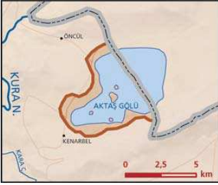
Aktaş Gölü önemli doğa alanı topografya haritası