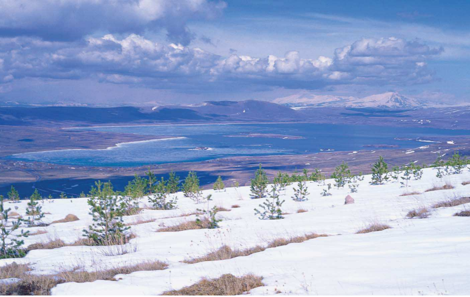
Aktaş Gölü

Yüzölçümü : 2392 ha Boylam : 43,20°D Enlem : 41,20°K Koruma Statüleri : Yok