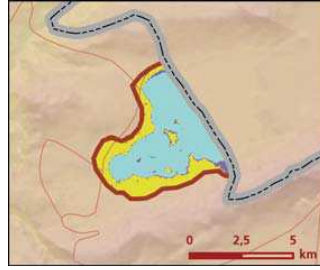
Aktaş Gölü önemli doğa alanı bitki örtüsü haritası