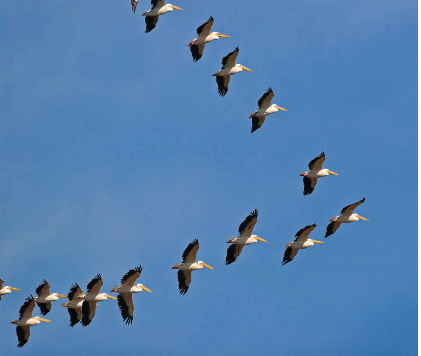
Ak pelikan ( Pelecanus onocrotalus ) © Özkan Ünner