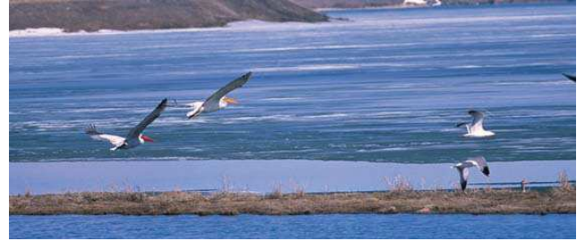
Aktaş Gölü