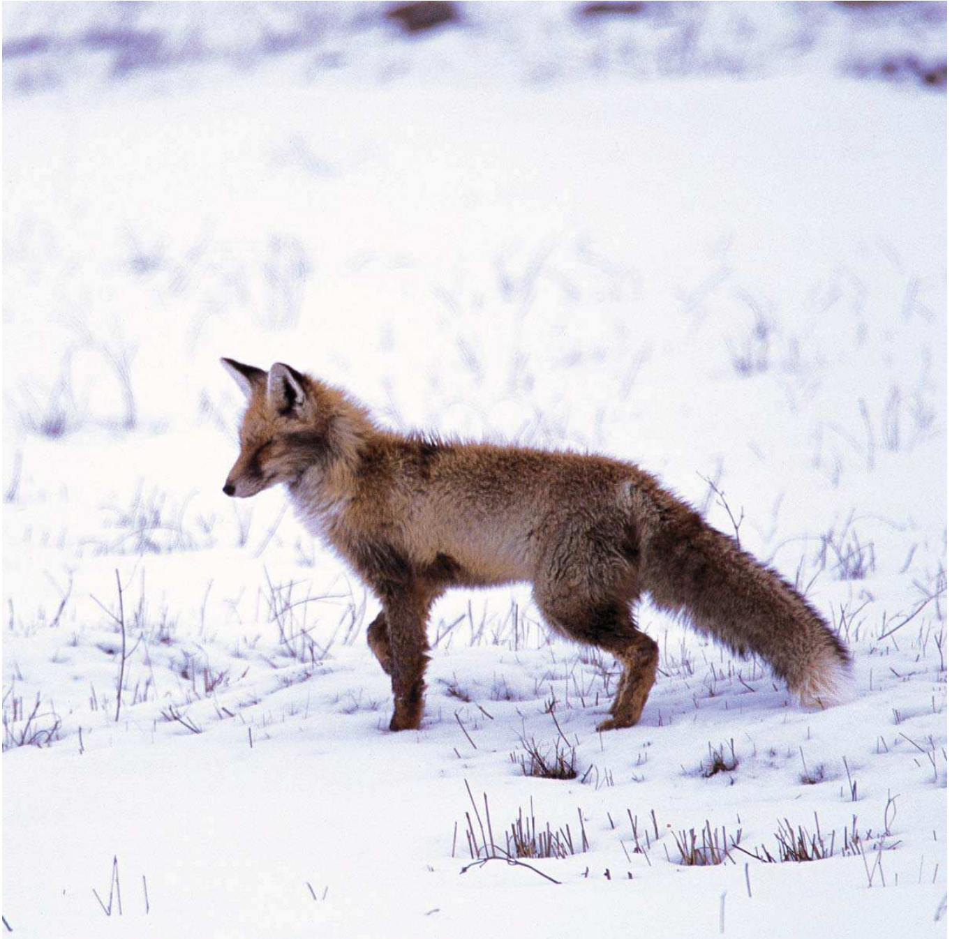
Tiki ( Vulpes vulpes )