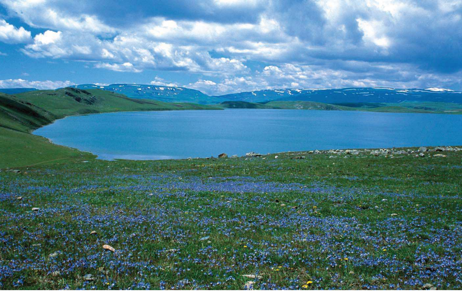
Aygır Gölü

Yüzölçümü : 2948 ha Boylam : 43,00°D Enlem : 40,76°K Koruma Statüleri : Yok Yükseklik : 1800 m - 2380 m İl(ler) : Kars İlçe(ler) : Susuz