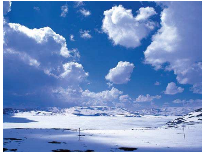
Aygır Gölü

■ Yerel İlgili Sahipleri Kars Valiliği; Kars Belediyesi; Kafkas Üniversitesi; Sürdürülebilir Karsal Kalkınma Derneği (SÖRKAL); Kars İli Çevre Koruma Vakfı; TEMA Vakfı Kars Temsilciliği; Kafkas Üniversitesi Kuş Gözlem Oluşumu.