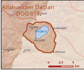
Aygır Gölü önemli doğa alanı topografya haritası