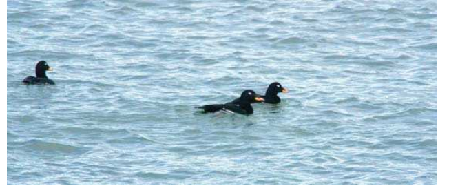
Kadife ördek ( Melanitta fusca ) © Arthur Grosset