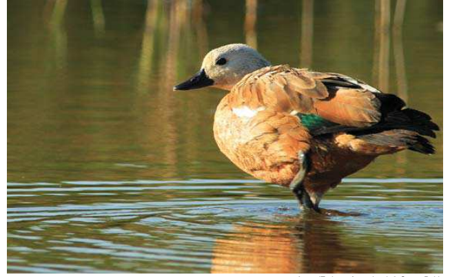
Anatya (Anatya ferruginea)