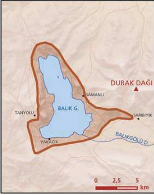
Balık Gölü önemli doğa alanı topografya haritası