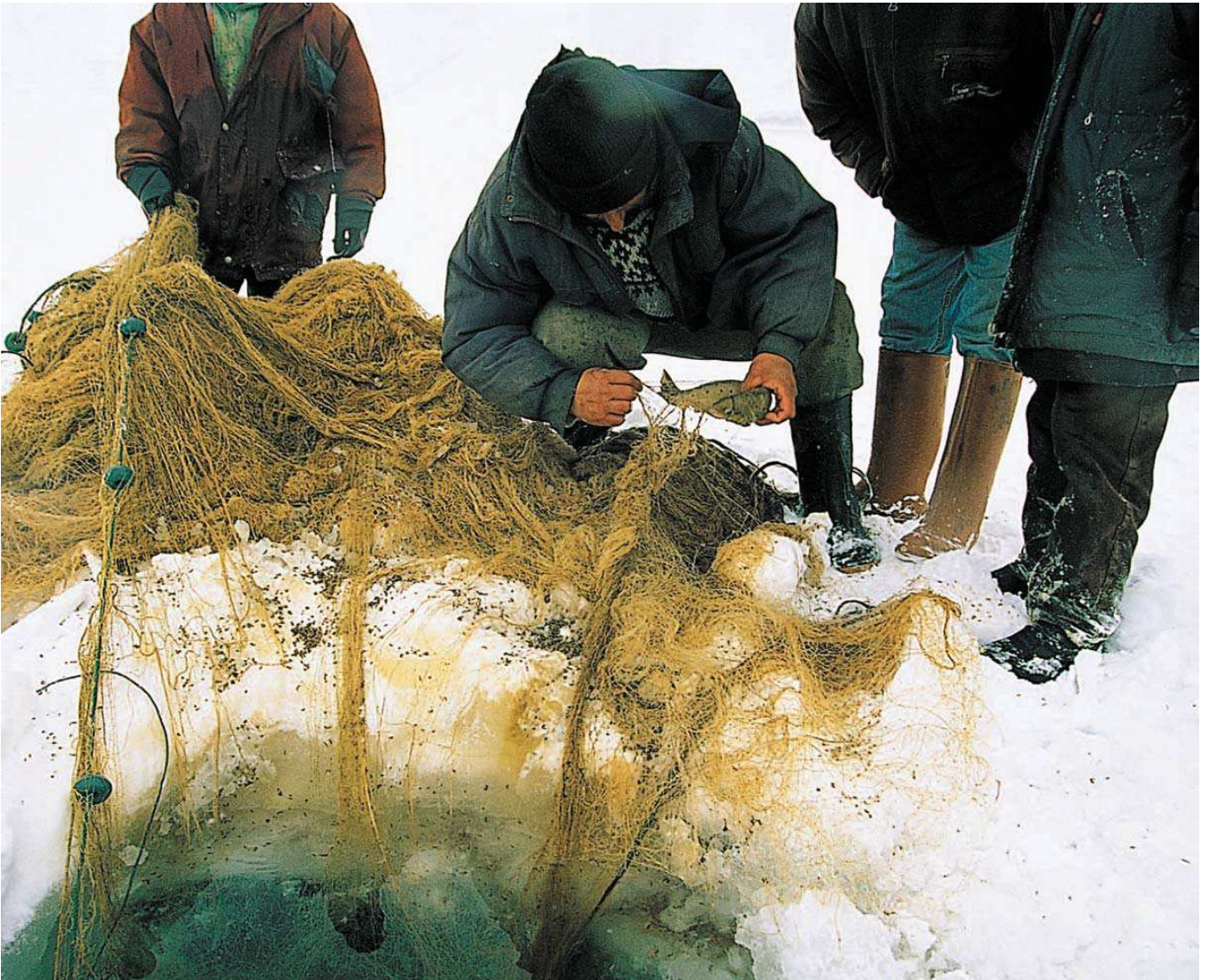
Balık Gölü