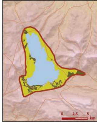
Balık Gölü önemli doğa alanı bitki örtüsü haritası