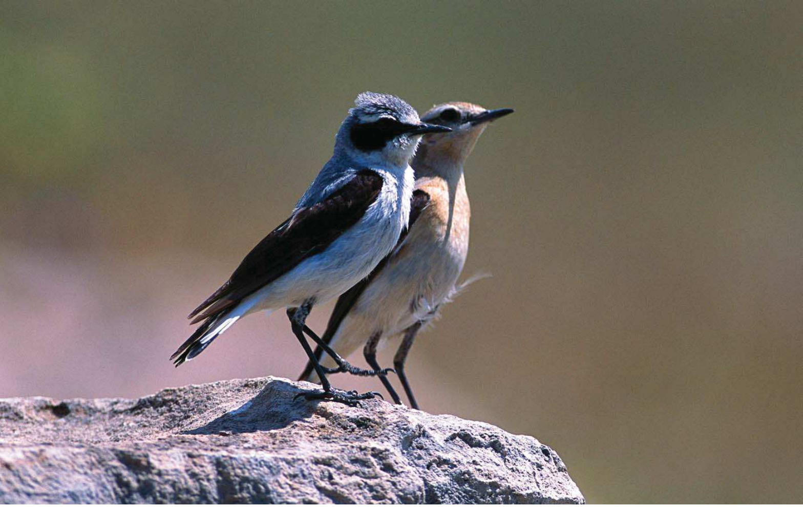
Kuyrukkakan ( Oenanthe oenanthe )

Yüzölçümü : 3411 ha Boylam : 42,30°D Enlem : 39,02°K Koruma Statüleri : Yok Yükseklik : 1580 m - 1670 m İl(ler) : Muş İlçe(ler) : Bulanık