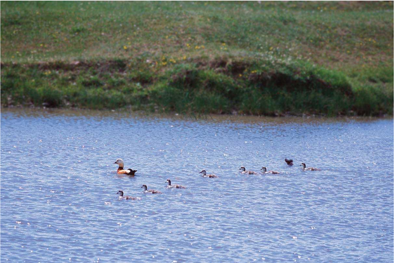
Angıt ( Tadorna ferruginea )