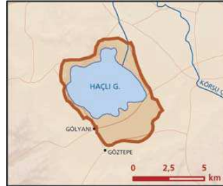
Haçlı Gölü önemli doğa alanı topografya haritası