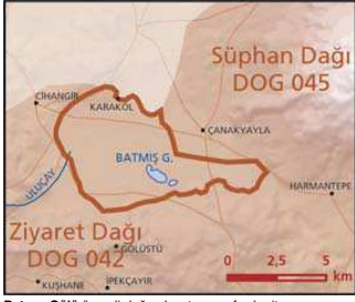
Batmış Gölü önemli doğa alanı topografya haritası