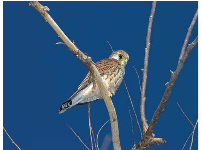
Küçük kerkenez ( Falco naumanni )

■ Yerel İlgili Sahipleri Bitlis Valiliği; Bitlis İl Çevre ve Orman Müdürlüğü; Ahlat Kaymakamlığı; Ahlat İlçe Jandarma Komutanlığı; Yüzüncü Yıl Üniversitesi Biyoloji Bölümü; Yüzüncü Yıl Üniversitesi Kuş Gözlem Oluşumu.