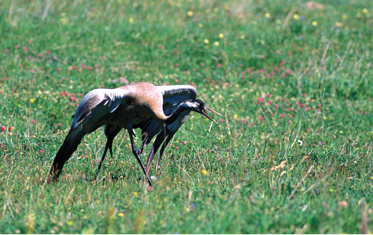
Turna ( Grus grus )

Yüzölçümü : 3395 ha Boylam : 42,65°D Enlem : 38,90°K Koruma Statüleri : Yok Yükseklik : 2210 m - 2240 m İl(ler) : Bitlis İlçe(ler) : Ahlat