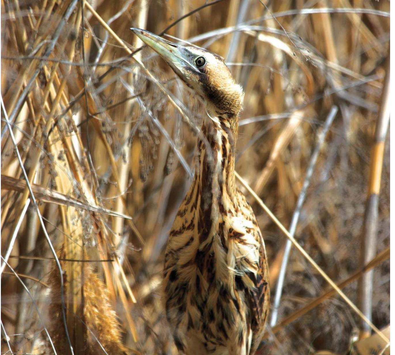
Balaban ( Botaurus stellaris )