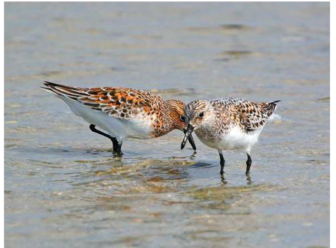
Küçük kumkuşu ( Calidris minuta ) © Kazım Çapacı