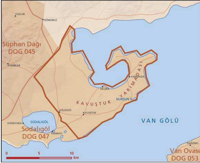
Kavuşuk Yarımadası önemli doğa alanı topografya haritası