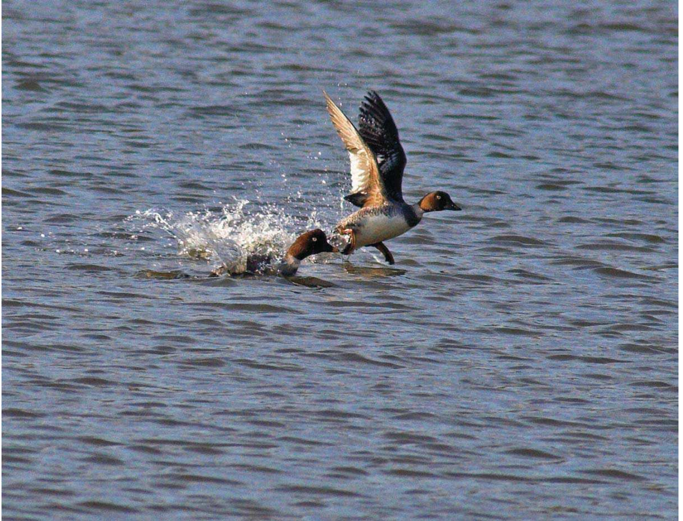
Altıngöz ( Bucephala clangula )