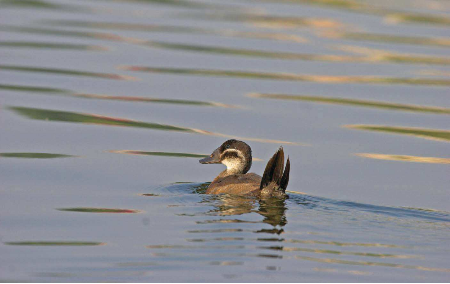
Dikkuyruk ( Oxyura leucocephala )