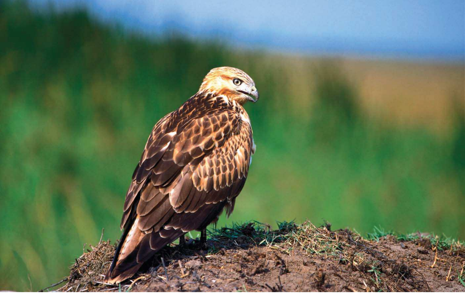
Kızıl şahin ( Buteo rufinus )

Yüzölçümü : 1736 ha Boylam : 43,75°D Enlem : 39,17°K Koruma Statüleri : Yok Yükseklik : 2230 m - 2520 m il(ler) : Van ilçe(ler) : Muradiye