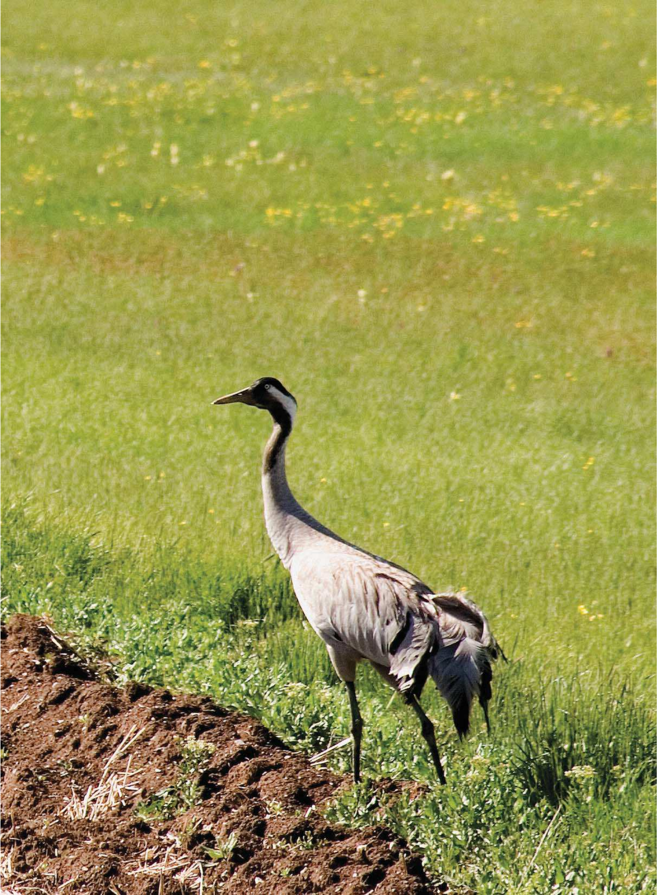
Turna ( Grus grus )