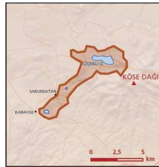
Çiçekli Gölleri önemli doğa alanı topografya haritası