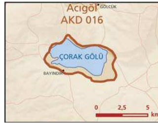
Çorak Gölü önemli doğa alanı topografya haritası