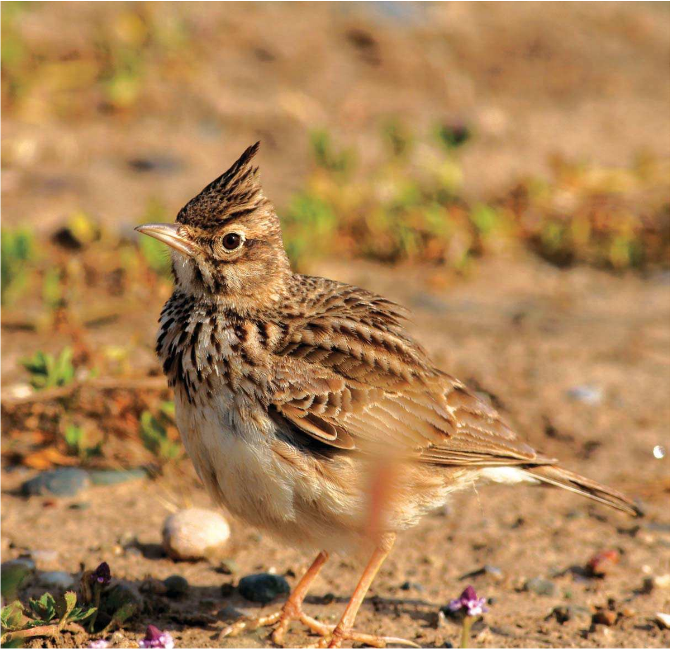
Tepeli toygar ( Galerida cristata )