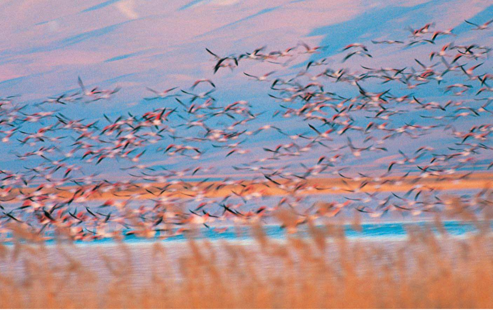
Flamingolar ( Phoenicopterus roseus )

Yüzölçümü : 2622 ha Boylam : 29,96°D Enlem : 37,57°K Koruma Statüleri : Yok Yükseklik : 905 m - 1020 m İl(ler) : Burdur İlçe(ler) : Burdur merkez, Yeşilova