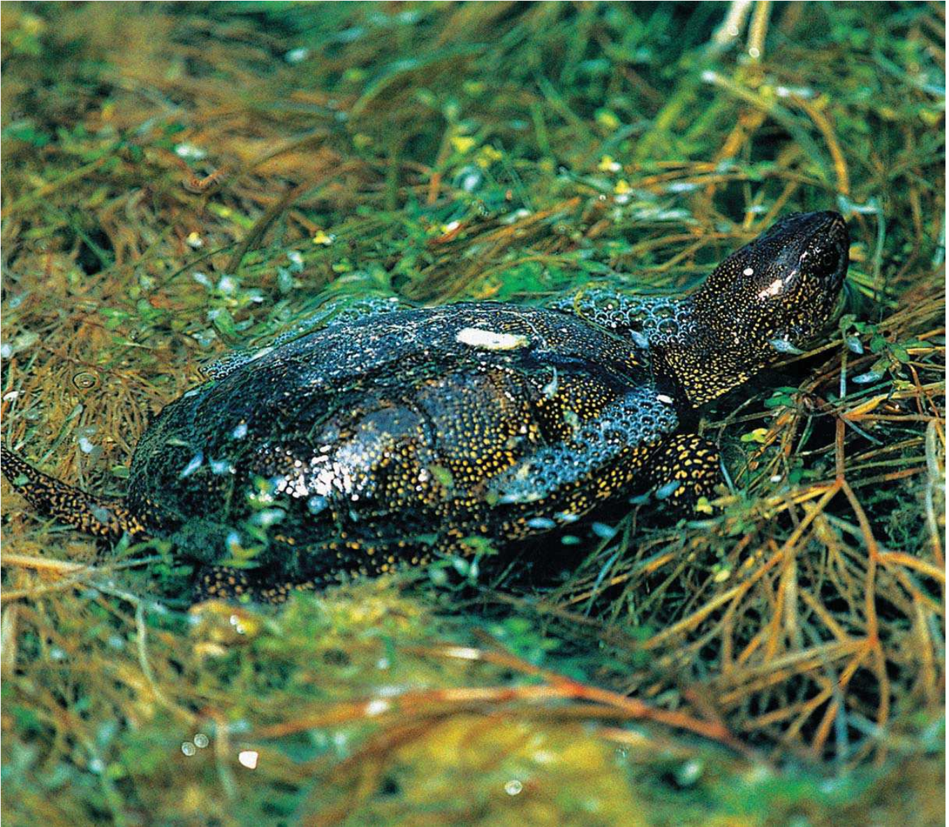
Benekli kaplumbağa ( Emys orbicularis )