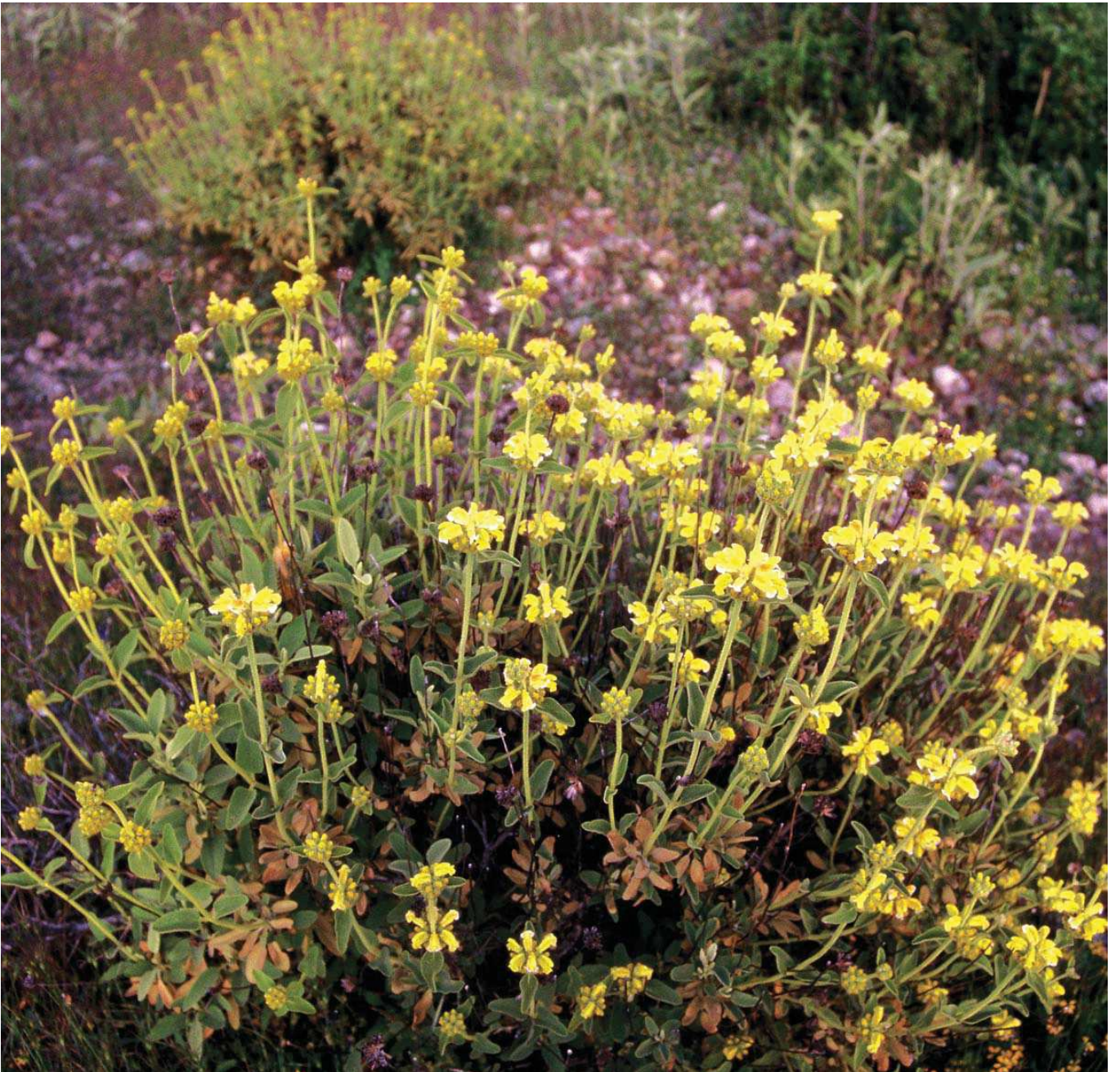
Phytolacca leucophracta