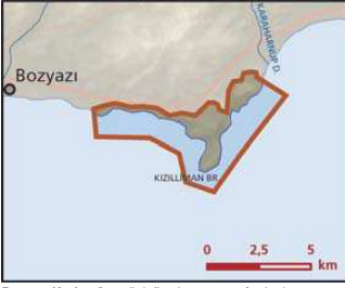
Bozyazi Kıyılar önemli doğa alanı topografya haritası