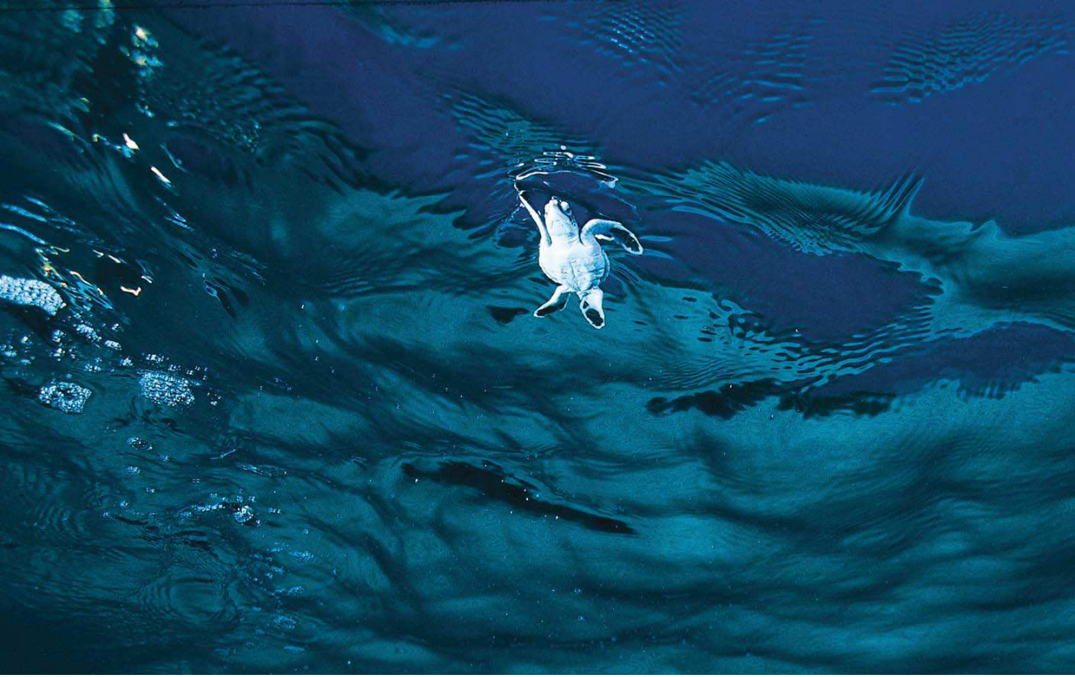
Yeşil deniz kaplumbağası ( Chelonia mydas )

Yüzölçümü : 1617 ha Boylam : 34,78°D Enlem : 36,80°K Koruma Statüleri : Doğal sit alanı Yükseklik : 0 m - 12 m İl(ler) : Mersin İlçe(ler) : Kazanlı, Yayladağı