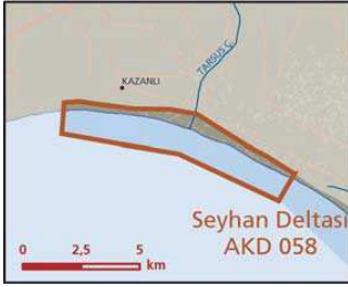
Kazanlı önemli doğa alanı topografya haritası