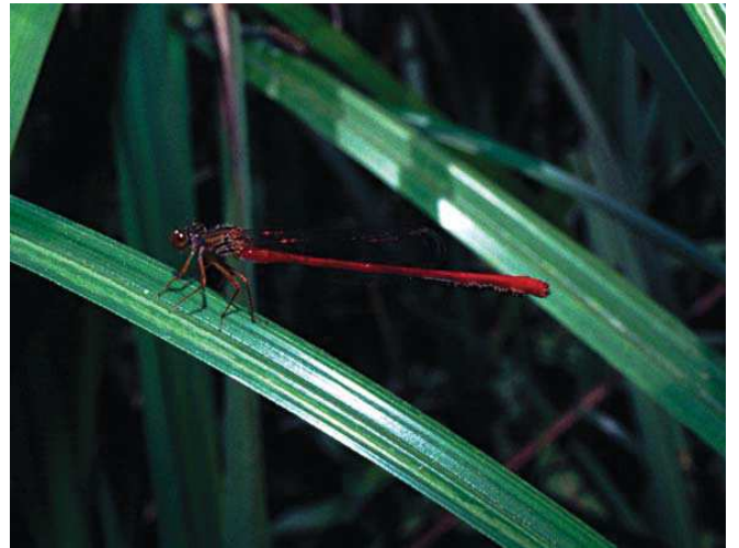
Ceragrion georgifreyi

■ Yerel İlgili Sahipleri Mersin Valiliği; Mersin Jandarma Komutanlığı; Kazanlı Kaymakamlığı; Kazanlı Belediyesi; Mersin Çevre ve Orman Müdürlüğü; Kazanlı Kaymakamlığı; Kazanlı Belediyesi; Kazanlı Chelonia Mydas Çevre Koruma Demeği; WWF Türkiye.