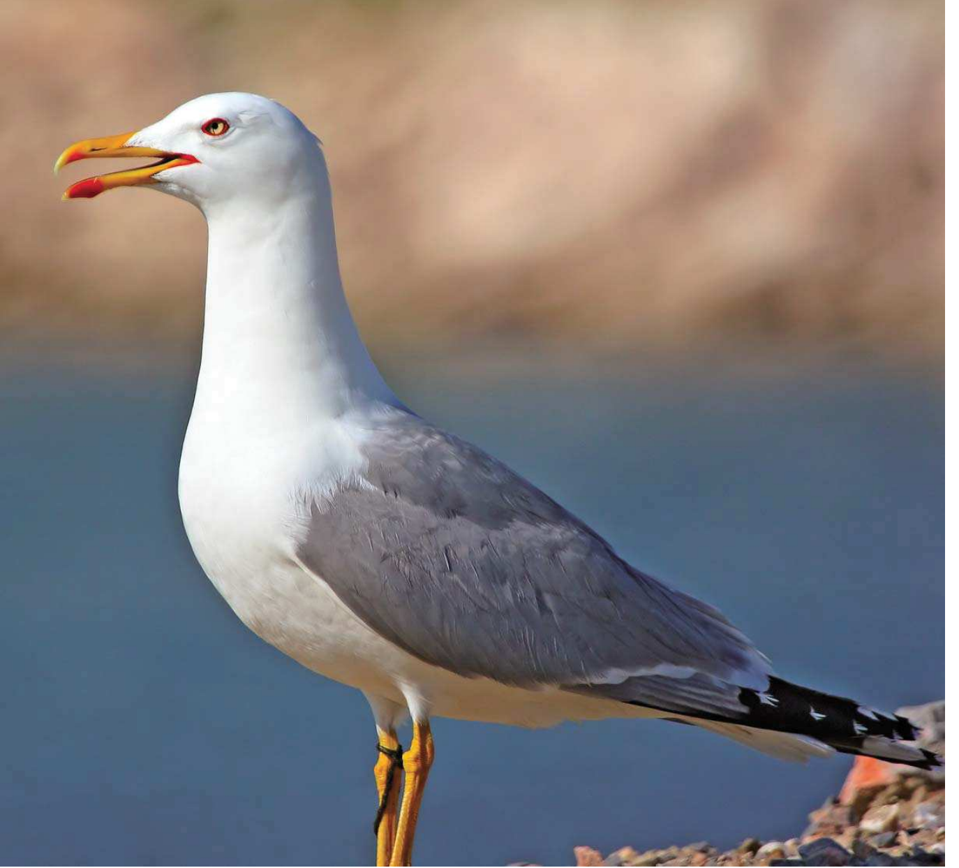
Gümüş martı ( Larus cachinnans michahellis )