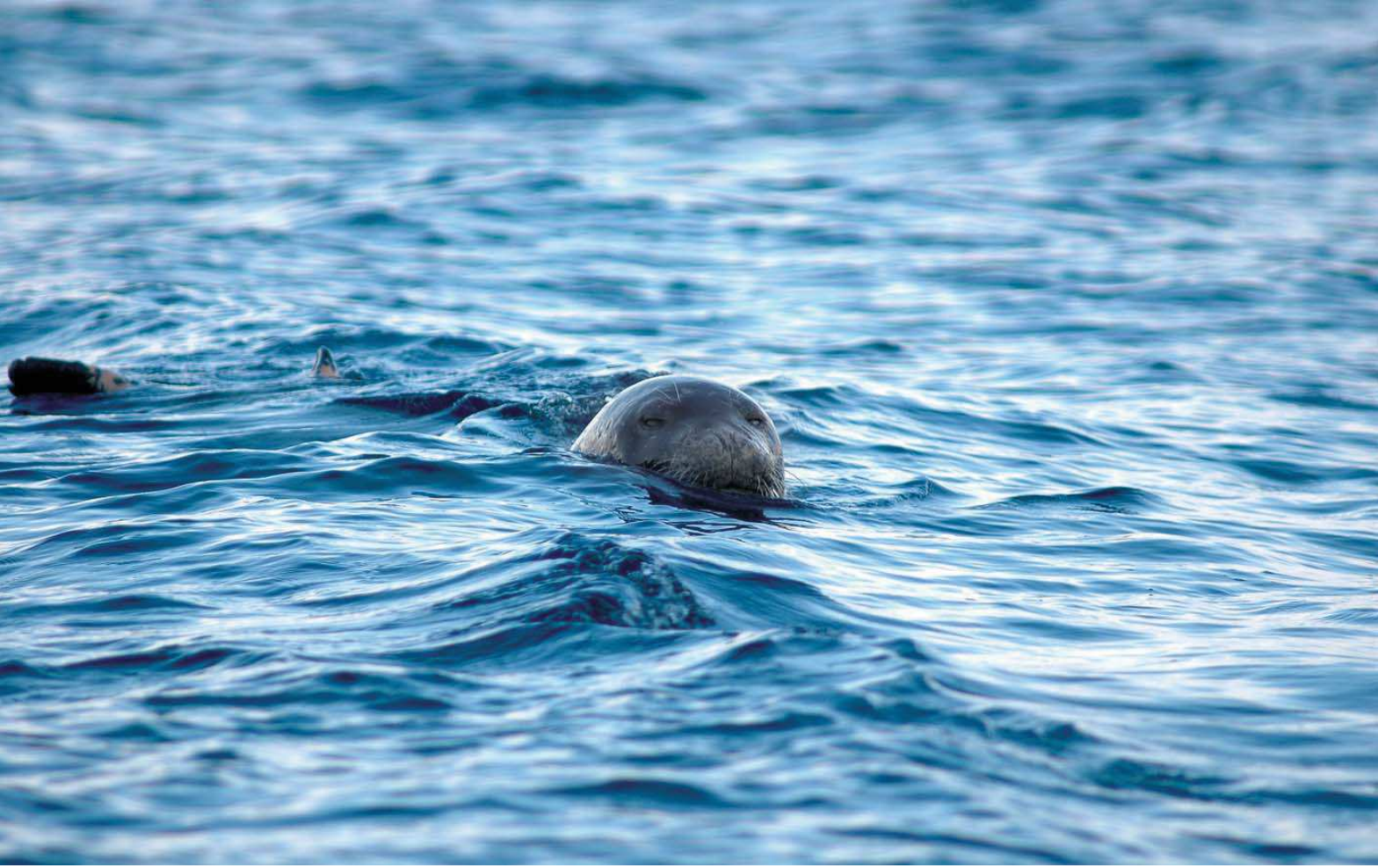
Akdeniz fokı ( Monachus monachus )

Yüzölçümü : 3465 ha Boylam : 26,22°D Enlem : 38,28°K Koruma Statüleri : Doğal sit alanı Yükseklik : 0 m - 40 m İl(ler) : İzmir İlçe(ler) : Çeşme