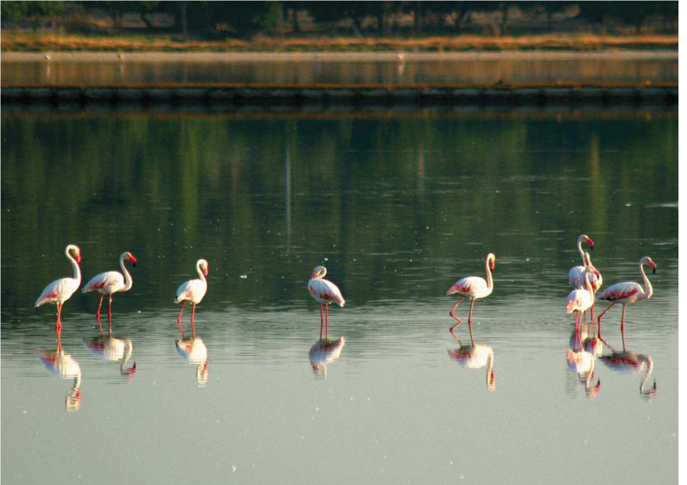
Flamingo ( Phoenicopterus roseus )