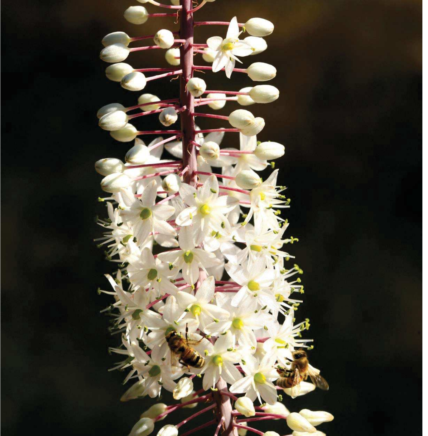
Adasogani ( Urginea maritima )