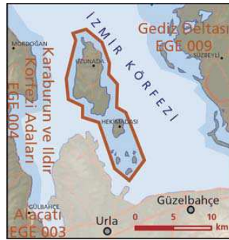
Çiçek Adaları önemli doğa alanı topografya haritası