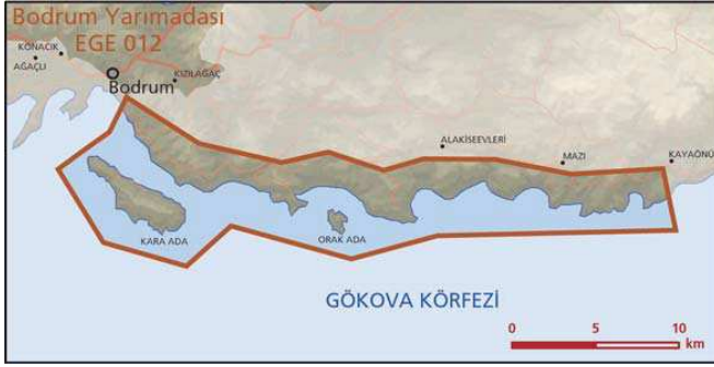
Gökova Kuzey Kıyıları önemli doğa alanı topografya haritası