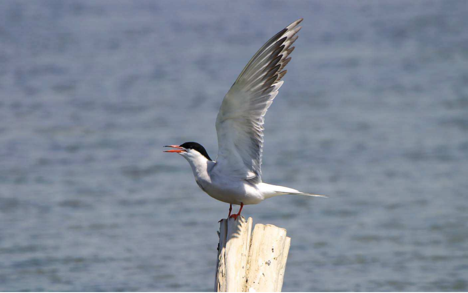
Sumru ( Sterna hirundo )

Yüzölçümü : 18347 ha | Yükseklik : 0 m - 450 m Boylam : 27,59°D | il(ler) : Muğla Enlem : 36,99°K | ilçe(ler) : Milas, Bodrum Koruma Statüleri : Doğal sit alanı