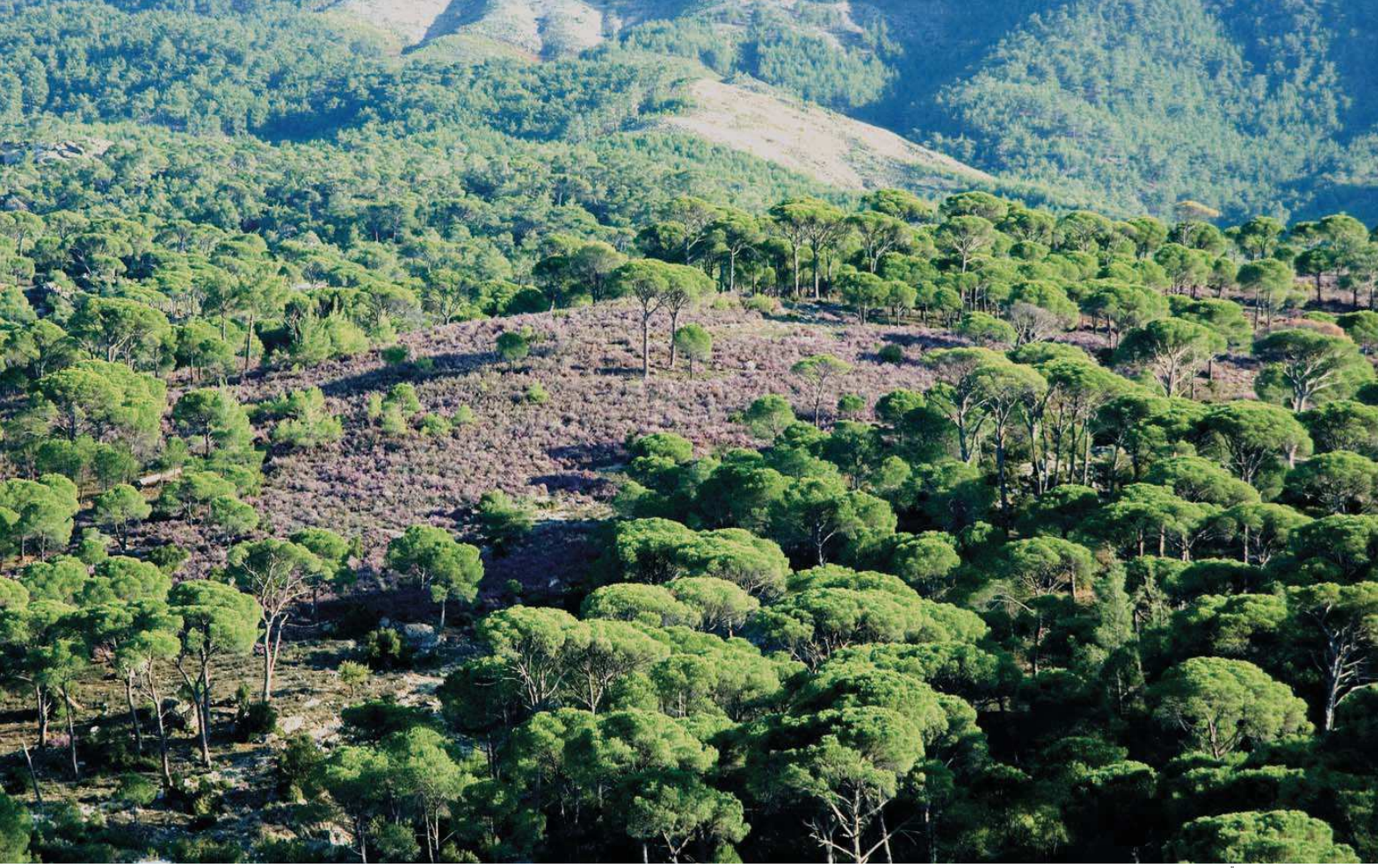
Batı Mentеше Dağları

Yüzölçümü : 142222 ha | Yükseklik : 10 m - 1422 m Boylam : 27,76°D | İl(ler) : Aydın, Muğla Enlem : 37,49°K | İlçe(ler) : Söke, Koçarlı, Çine, Karpuzlu, Yenihisar, Yatağan, Milas Koruma Statüleri : Doğal sit alanı, arkeolojik sit alanı