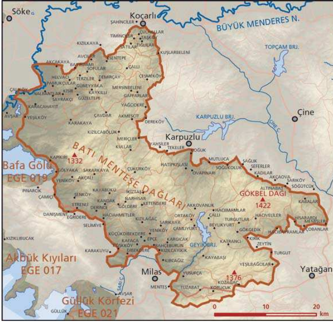
Batı Menteşe Dağları önemli doğa alanı topografya haritası