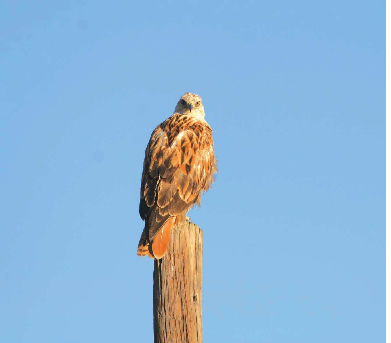
Kızıl şahin ( Buteo rufinus )