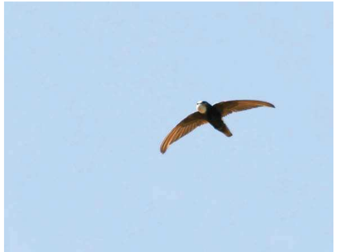
Küçük ebabil ( Apus affinis )

■ Koruma Çalışmaları : Bilinen bir koruma çalışması bulunmamaktadır.