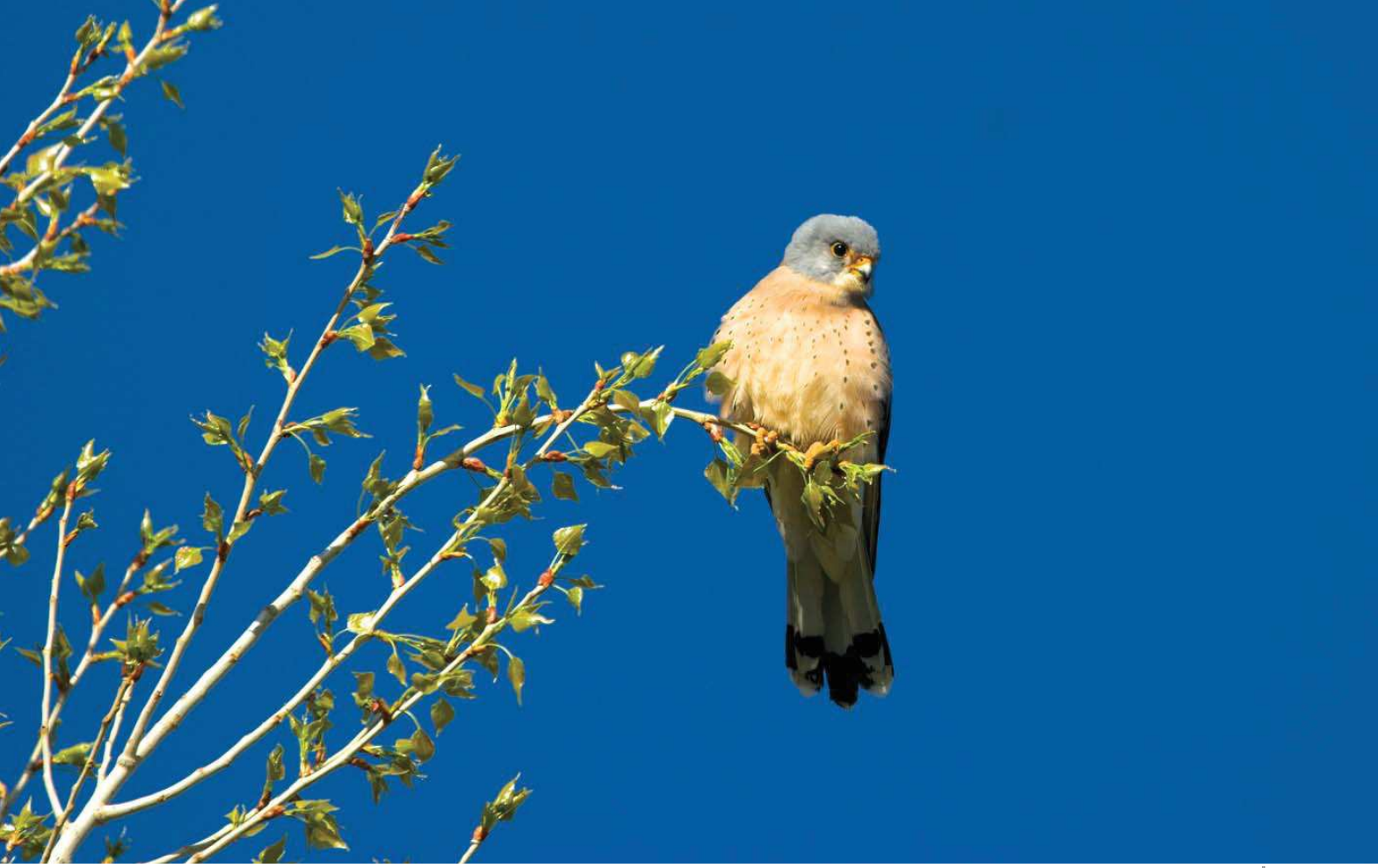
Küçük kerkenez ( Falco naumanni )