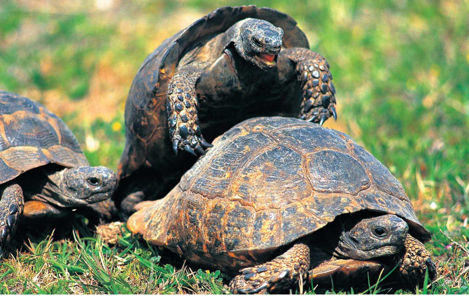
Tosbağa ( Testudo graeca )

Yüzölçümü : 2287 ha Boylam : 37,46°D Enlem : 36,65°K Koruma Statüleri : Yok Yükseklik : 490 m - 550 m İl(ler) : Kilis İlçe(ler) : Kilis merkez, Elbeyli