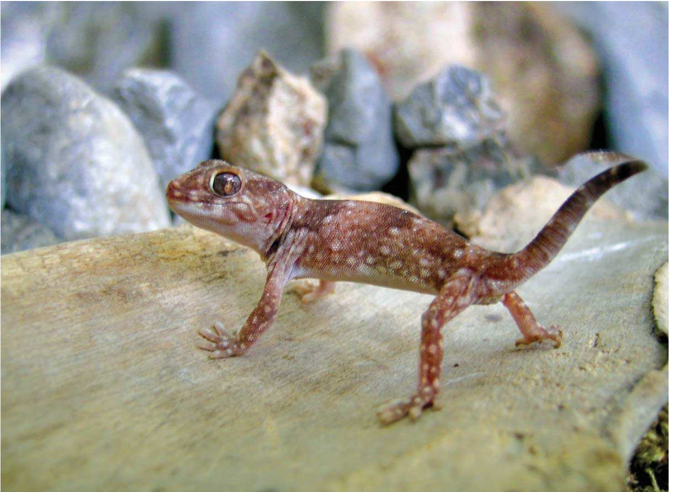
Tombul keler ( Stenodactylus grandiceps )