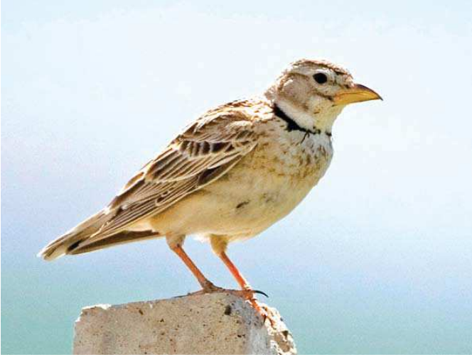
Boğmaki toygar ( Melanocorypha calandra )