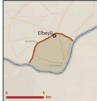
Elbeyli önemli doğa alanı topografya haritası