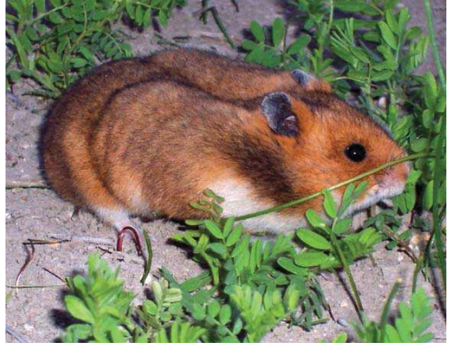
Altın avurtlak ( Mesocricetus auratus )