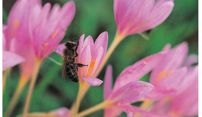
Colchicum micranthum