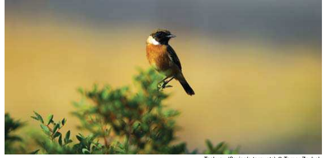
Taşkuşu ( Saxicola torquata )