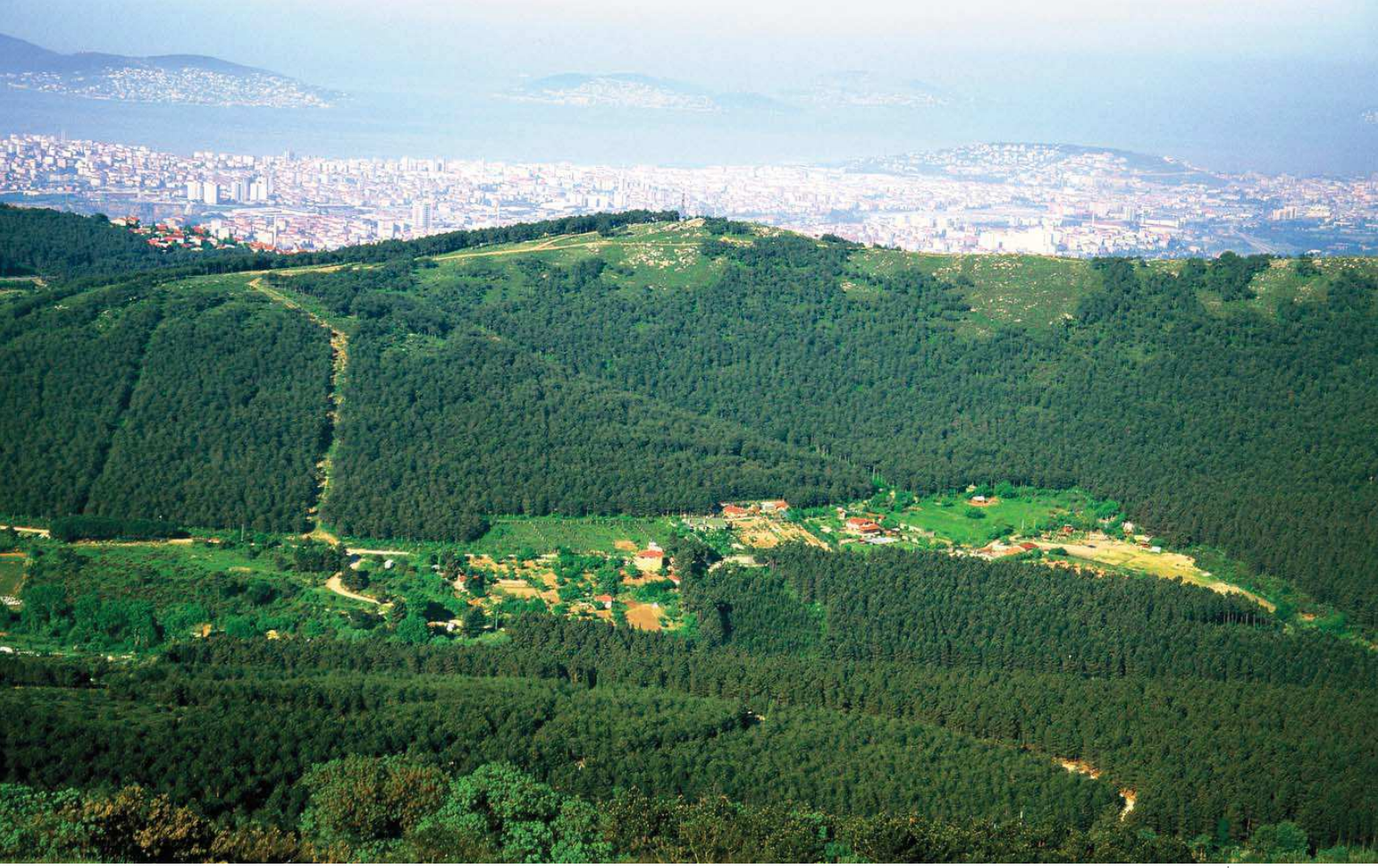
Aydos Tepesi