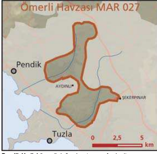
Pendik Vadisi önemli doğa alanı topografya haritası