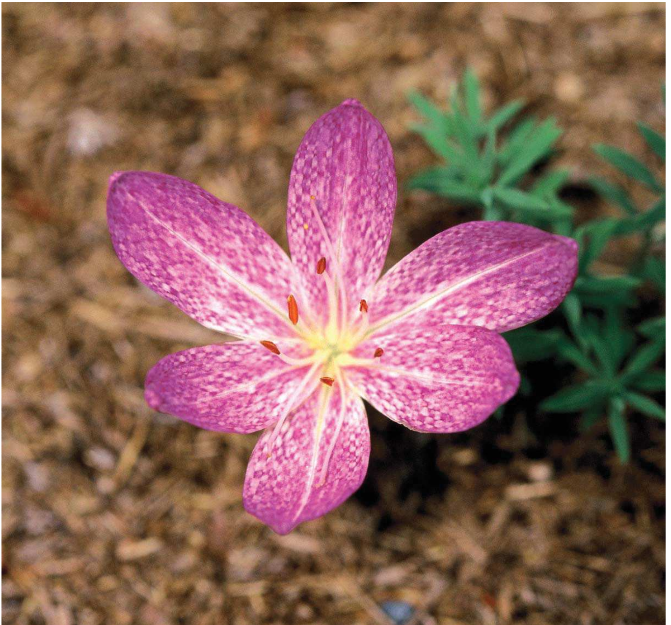
Kadıköy acıçıldemi ( Colchicum chalcedonicum )