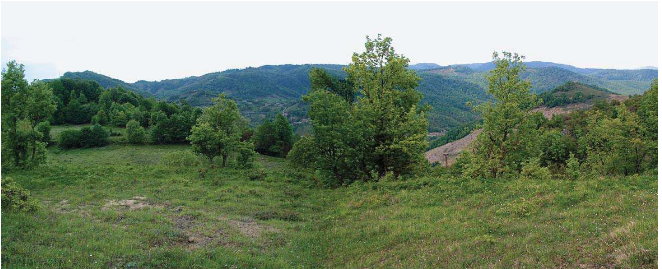
Sofular Tepeleri