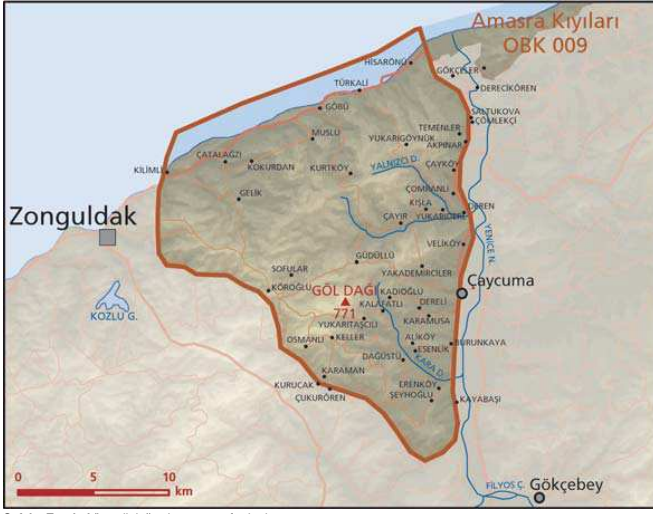
Sofular Tepeleri önemli doğa alanı topografya haritası