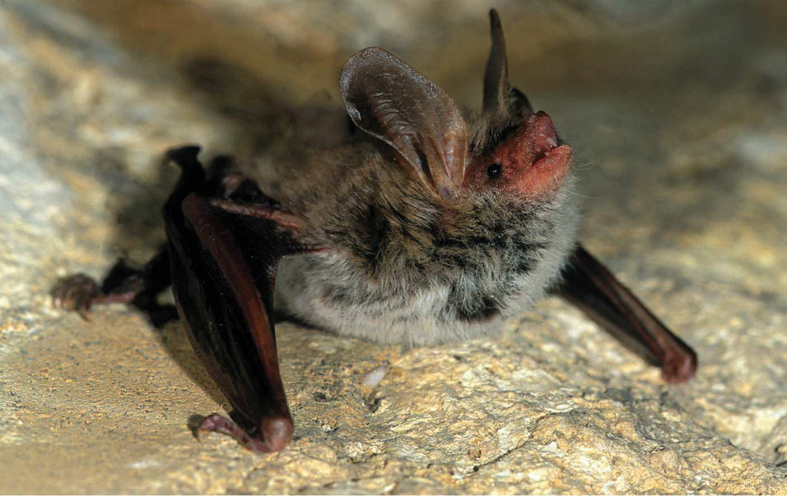
Büyükkulaklı yarasası ( Myotis bechsteini )

Yüzölçümü : 36241 ha Boylam : 31,98°D Enlem : 41,46°K Koruma Statüleri : Yok Yükseklik : 0 m - 771 m İl(ler) : Zonguldak İlçe(ler) : Zonguldak merkez, Çaycuma, Gökçebey