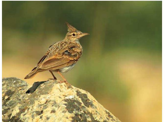
Tepeli toygaz ( Galerida cristata )