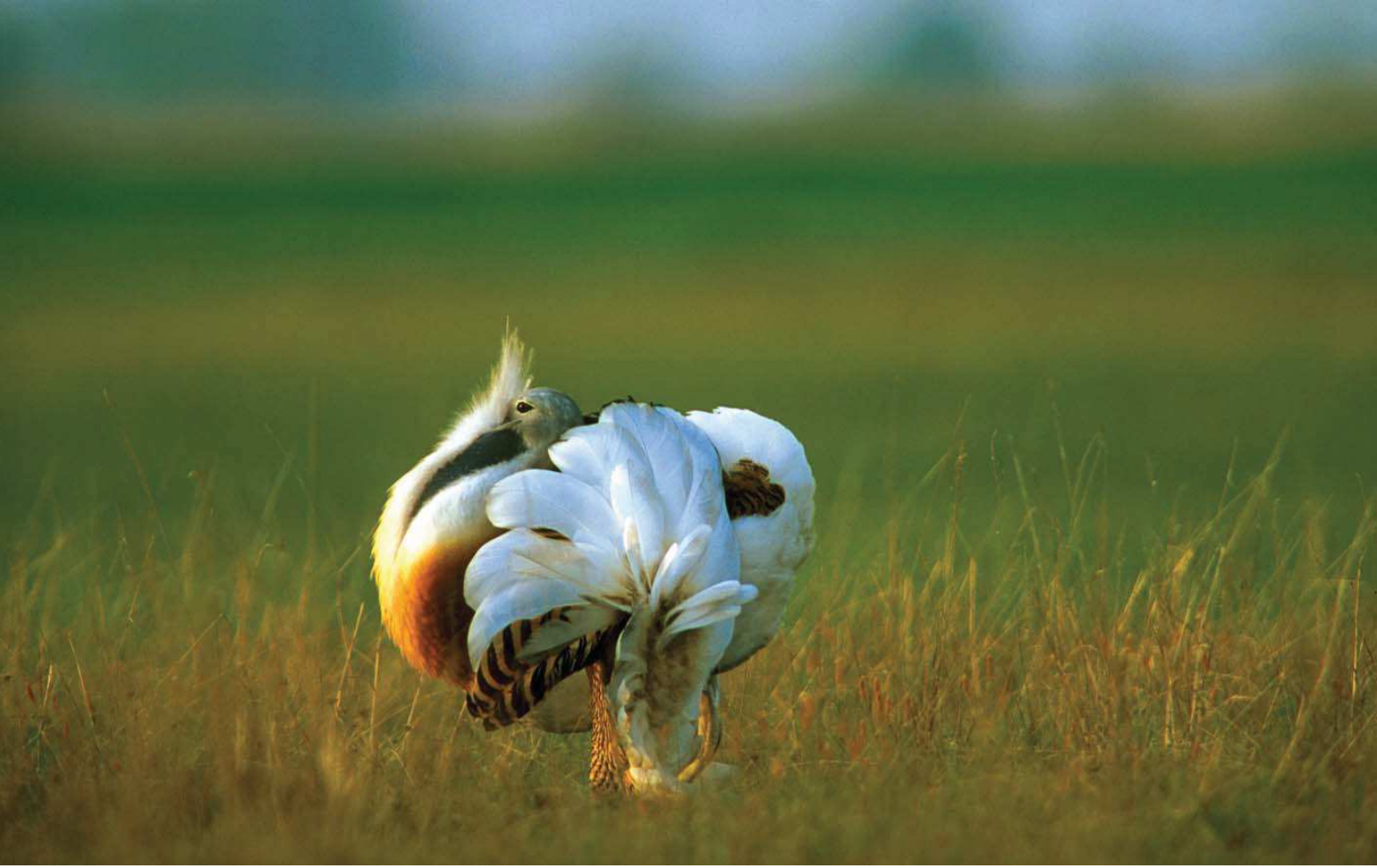
Toy ( Otis tarda ) © Franz Josef Kovacs