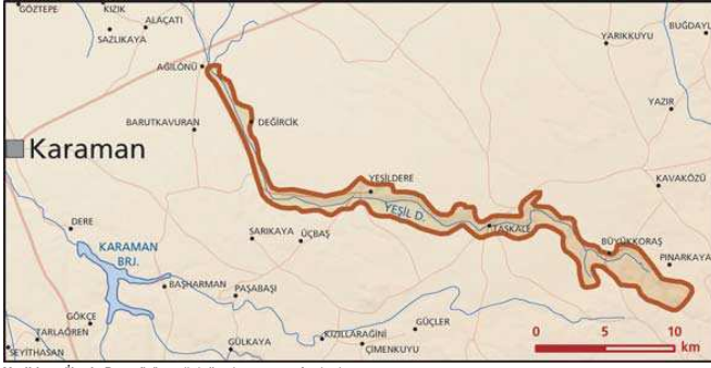
Yeşildere (Ibrala Deresi) önemli doğa alanı topografya haritası