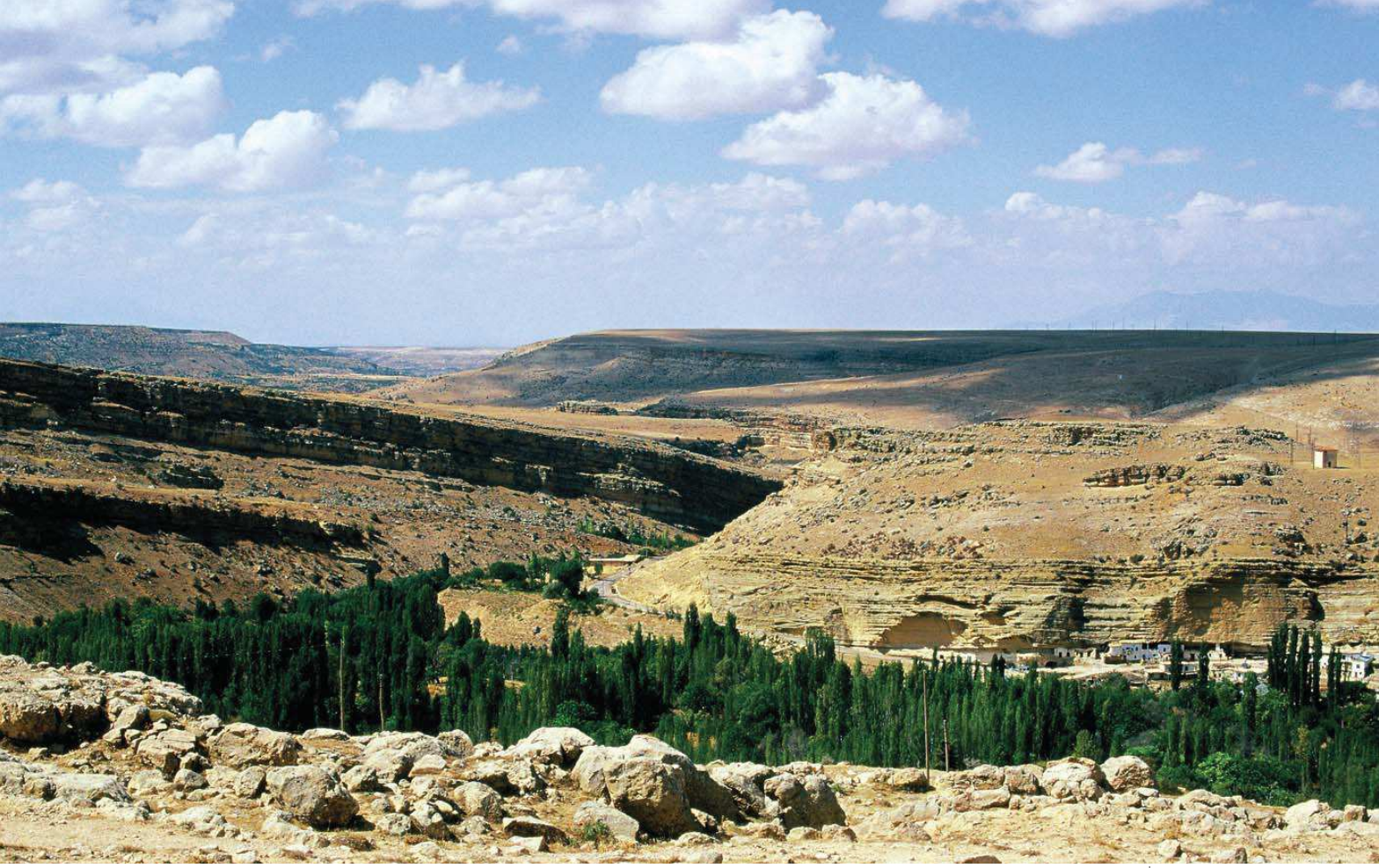
İbrala Deresi

Yüzölçümü : 6359 ha Boylam : 33,05°D Enlem : 37,01°K Koruma Statüleri : Yok Yükseklik : 1035 m - 1730 m İl(ler) : Karaman İlçe(ler) : Karaman merkez, Ayrancı