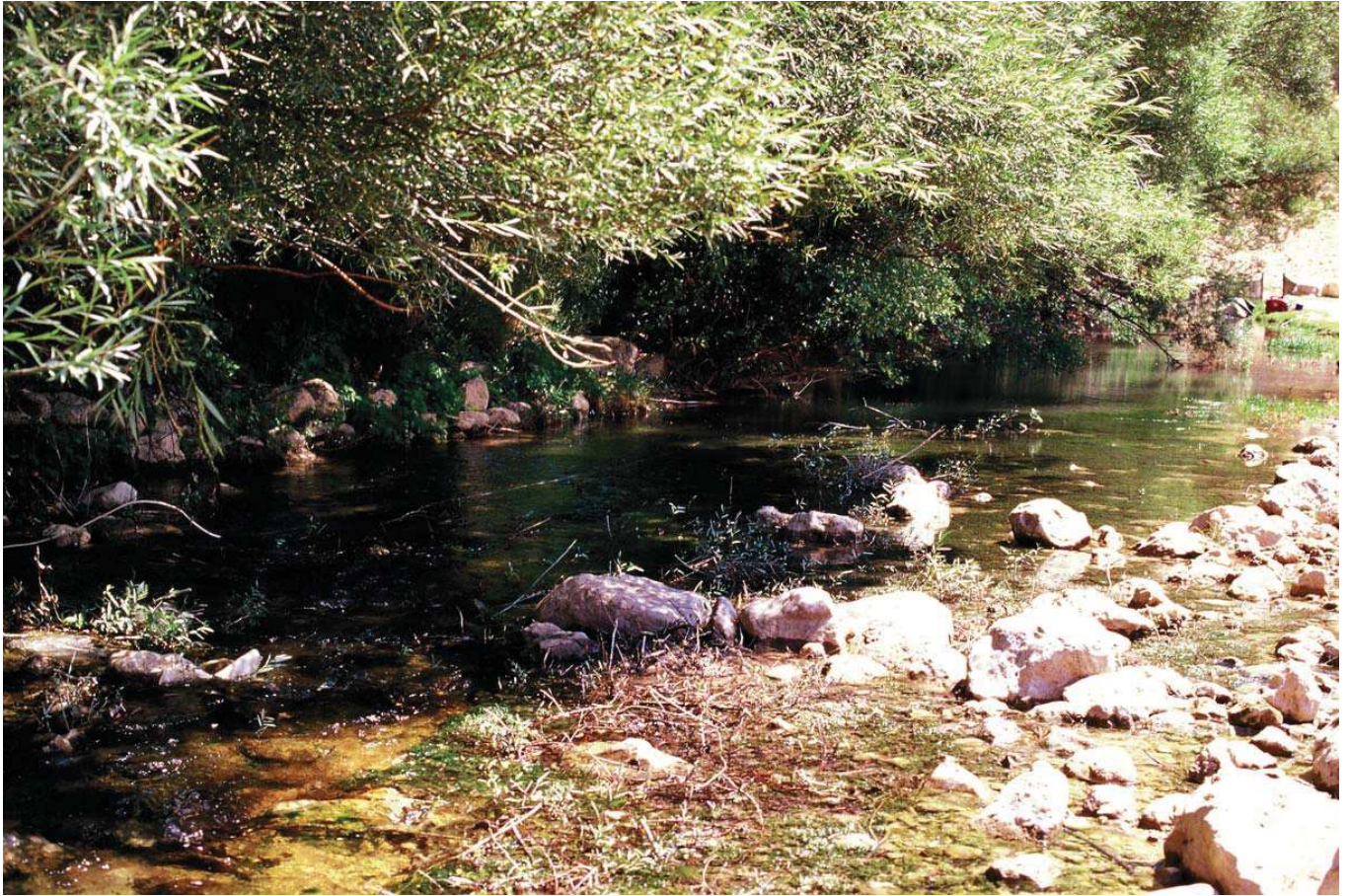
Ibrala Deresi