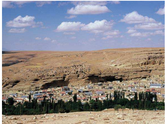
İbrala Deresi

■ Yerel İlgili Sahipleri Karaman Valiliği, Tarım ve Köylüleri Bakanlığı, Yeşildere Belediyesi, Taşkale Belediyesi.