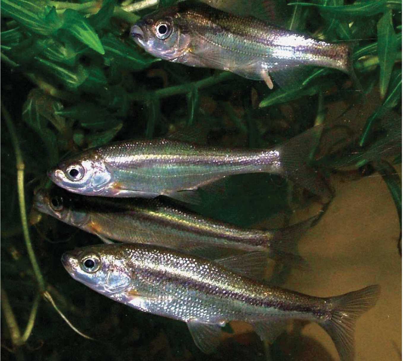
Pseudophoxinus anatolicus