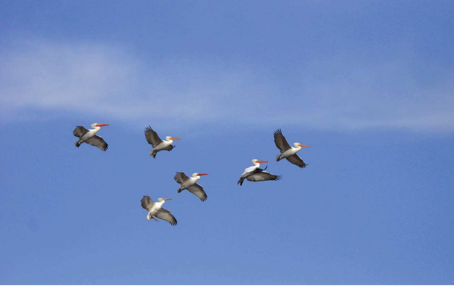
Tepeli pelikan ( Pelecanus crispus )

Yüzölçümü : 705 ha Boylam : 34,62°D Enlem : 37,93°K Koruma Statüleri : Yok Yükseklik : 1180 m - 1210 m il(ler) : Niğde ilçe(ler) : Niğde merkez