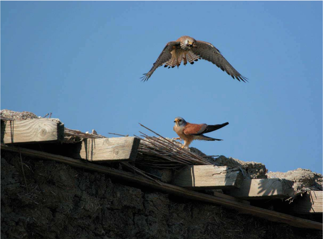
Küçük kerkenez ( Falco naumanni )