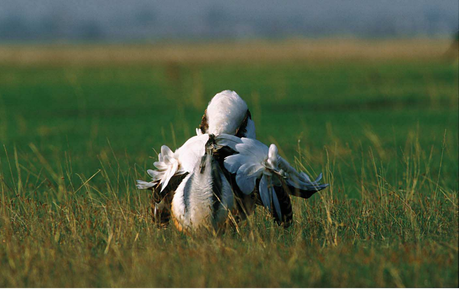
Toy (Otis tarda)