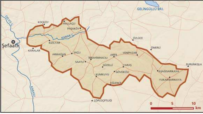
Yenipazar önemli doğa alanı topografya haritası