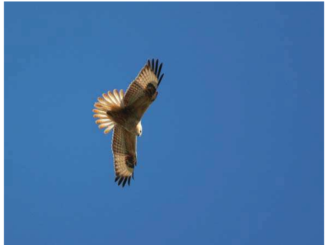
Kızı şahin ( Buteo rufinus )