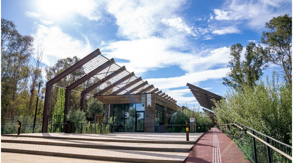
İzmir Tarımı Geliştirme Merkezi- İZTAM girişi dıştan görünümü

Festivalin ilk iki günü İzmir Büyükşehir Belediyesi'ne ait İzmir Tarımı Geliştirme Merkezi- İZTAM 'da gerçekleşiyor.